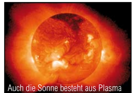
Auch die Sonne besteht aus Plasma