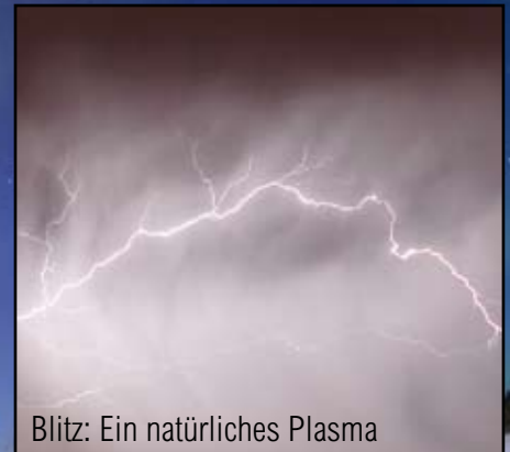
Blitz: Ein natürliches Plasma