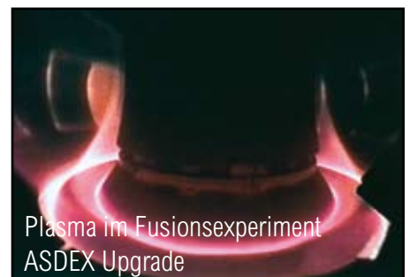
Plasma im Fusionsexperiment ASDEX Upgrade